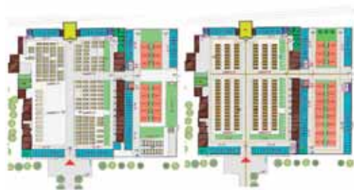
Progetto del cimitero di Briana "oggi" e in "futuro"

Il piano cimiteriale ci dà un quadro corretto a cui fare riferimento per operare con saggezza amministrativa ed intervenire con metodo ed urgenza dove è necessario.