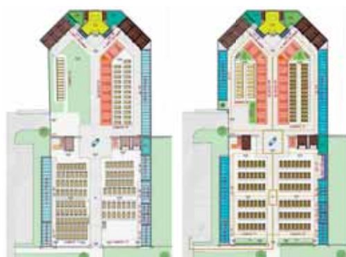
Progetto del cimitero di Cappelletta "oggi" e in "futuro"