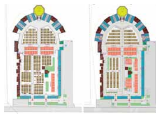
Progetto del cimitero di Moniego "oggi" e in "futuro"